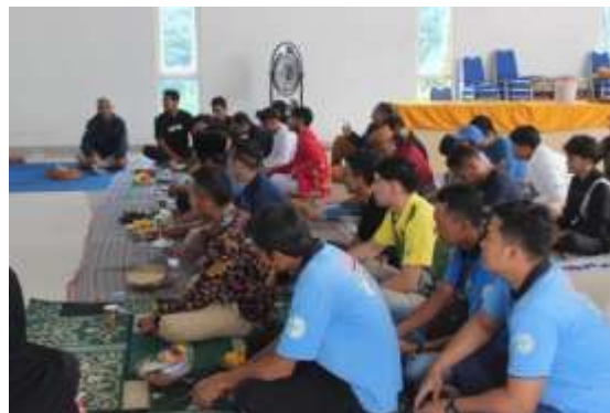
Gambar 3. Dokumentasi kegiatan

Pembentukan rute wisata ini melalui proses Focused Group Discussion (FGD) yang melibatkan kelompok tani, pemuda desa, pelaku UMKM, dan perangkat desa. Melalui pendekatan partisipatif seperti yang dianjurkan dalam model Participatory Rural Appraisal (Chambers, 2020), masyarakat diberi ruang untuk mengemukakan potensi, kendala, serta aspirasi dalam pengembangan wisata desa. Kelompok tani memberikan informasi teknis mengenai siklus produksi kopi, pemuda desa menyediakan perspektif inovatif terkait aktivitas wisata, sementara perangkat desa membantu menyediakan dukungan administratif dan regulatif. Sinergi antarkomponen ini memperkuat keberlanjutan rute wisata karena seluruh elemen masyarakat merasa memiliki dan bertanggung jawab atas pengembangannya. Proses kolaboratif ini memastikan wisata yang dirancang tidak hanya mengejar nilai ekonomi, tetapi menghormati budaya lokal dan kelestarian lingkungan.