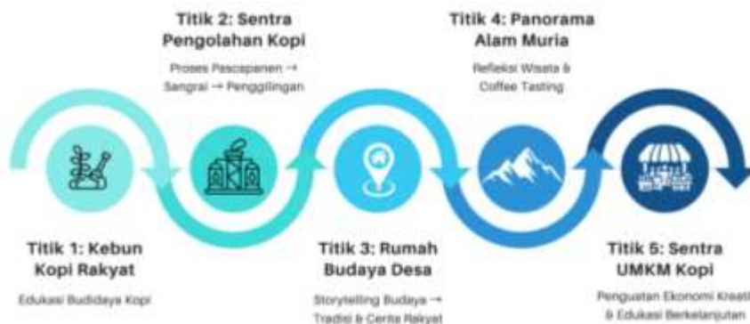
Gambar 4. Bagan Alur Perjalanan Wisata Kopi Budaya Desa Japan