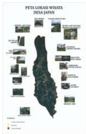
Gambar 2. Peta Desa Japan

Pendampingan pengembangan rute wisata kopi–budaya menghasilkan jalur wisata edukatif yang terdiri dari empat titik wisata utama, yaitu: kebun kopi rakyat, sentra pengolahan kopi, rumah budaya desa, dan titik panorama alam Muria. Setiap titik dirancang untuk memberikan pengalaman belajar yang berbeda, mulai dari pengenalan botani dan ekologi kopi, pengamatan proses pascapanen, hingga pemahaman mengenai sejarah dan budaya Desa Japan. Penyusunan rute tidak hanya mempertimbangkan aspek geografis dan aksesibilitas, tetapi alur cerita wisata ( tourism narrative flow ) agar pengalaman pengunjung terstruktur dan bermakna. Jalur yang terbentuk memungkinkan wisatawan menyaksikan langsung hubungan ekologis antara lanskap Muria, praktik pertanian kopi, dan budaya lokal yang saling bertautan. Rute ini dilengkapi titik-titik interpretasi yang memungkinkan wisatawan mendapatkan penjelasan mengenai sejarah kopi Muria dan nilai budaya yang diwariskan masyarakat setempat.