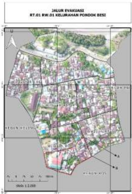
Gambar 2. Jalur evakuasi RT 01 RW.01 Kelurahan Pondok Besi