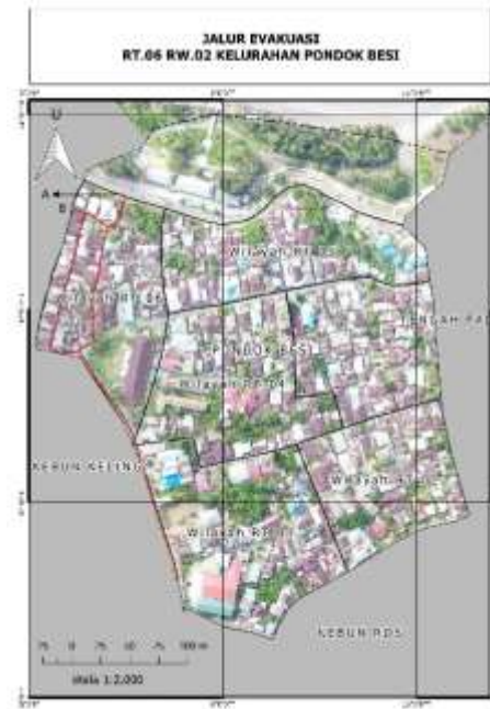
Gambar 7. Jalur evakuasi RT 06 RW.02 Kelurahan Pondok Besi