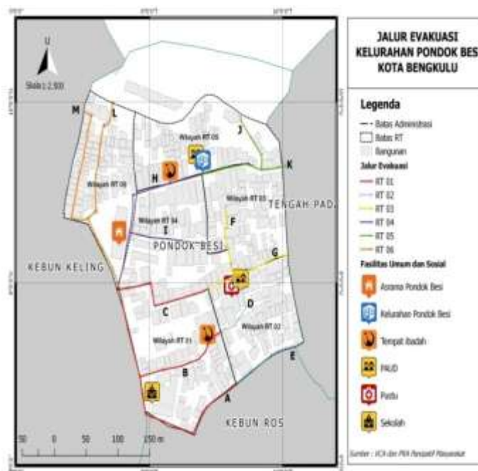
Gambar 8. Jalur Evakuasi Kelurahan Pondok Besi