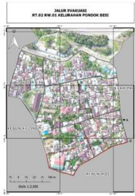
Gambar 3. Jalur evakuasi RT 02 RW.01 Kelurahan Pondok Besi