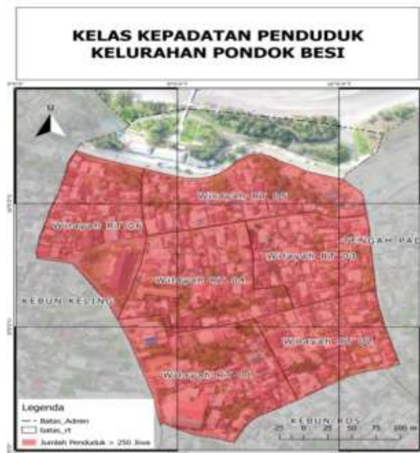
Gambar 11. Kelas Kepadatan Penduduk