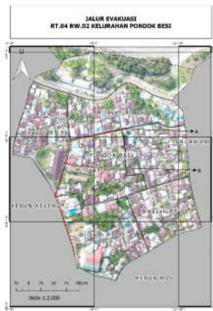
Gambar 5. Jalur evakuasi RT 04 RW.02 Kelurahan Pondok Besi