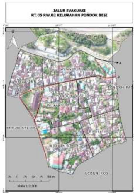
Gambar 6. Jalur evakuasi RT 05 RW.02 Kelurahan Pondok Besi