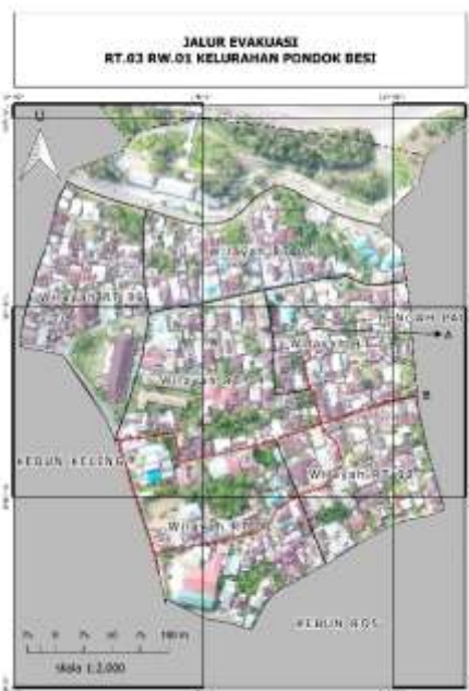
Gambar 4. Jalur evakuasi RT 03 RW.01 Kelurahan Pondok Besi