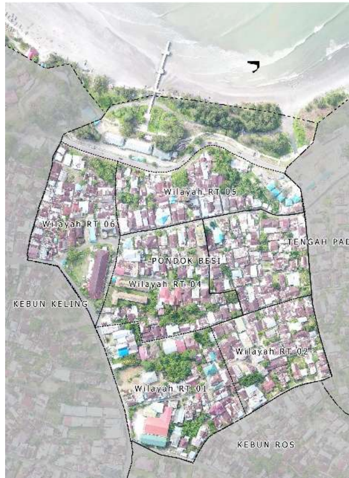
Gambar 1. Kelurahan Pondok Besi

Penelitian ini dilaksanakan di kelurahan pondok besi Bengkulu. Sebagai karakteristik model spasial daerah yang dianalisis berbasis GIS dan remote sensing. Fokus utama dalam penelitian ini adalah daerah Palu. Adapun lokasi penelitian di sajikan dalam bentuk gambar.