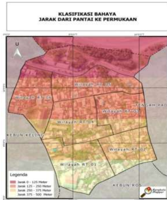
Gambar 9. Klarifikasi Bahaya Jarak Dari Pantai Ke Permukaan

diklasifikasikan sebagai daerah yang cukup berbahaya, dan RT 01 menjadi tempat terklasifikasikan kurang berbahaya.