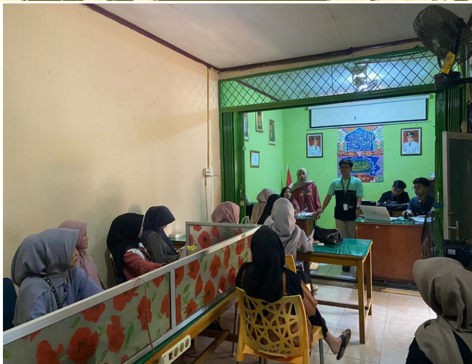
Gambar 3. Pelaksanaan Kegiatan