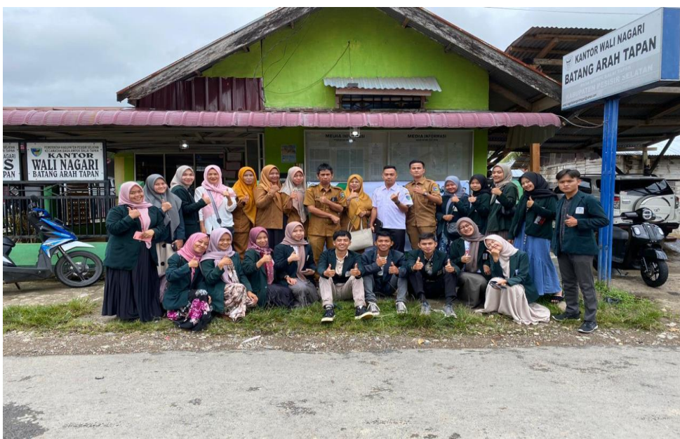
Gambar 2. Foto bersama pada saat studi pendahuluan

Pada hasil kegiatan dilapangan terbukti jika masyarakat masih belum mengetahui secara utuh terkait regulasi, sistem dan produk perbankan syariah. Fakta tersebut ditinjau dari Nasabah Bank Syariah nagari batang arah tapan. yang memiliki presentase hanya 15%. Diharapkan adanya program kegiatan pengabdian masyarakat sebagai jawaban atau solusi bagi masyarakat yang ingin memanfaatkan jasa perbankan tetapi ingin menerapkan transaksi perbankan berbasis agama Islam yaitu dengan memilih meneerapkan transaksi keuangan dengan perbankan syariah. Diharapkan pengabdian ini mampu menambahkan literasi keuangan syaria pada masyarakat yang lebi luas, serta dalam jangka panjang mengalami kenaikan prosentase pengguna jasa perbankan syariah dimasyarakat.