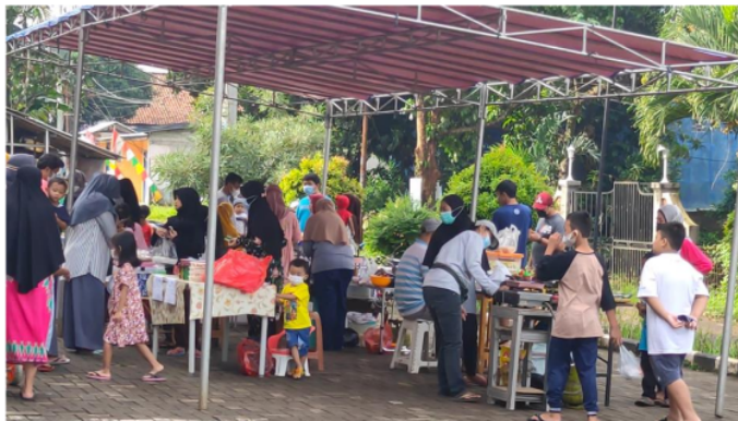
Gambar 2. Bentuk implementasi setelah penyuluhan