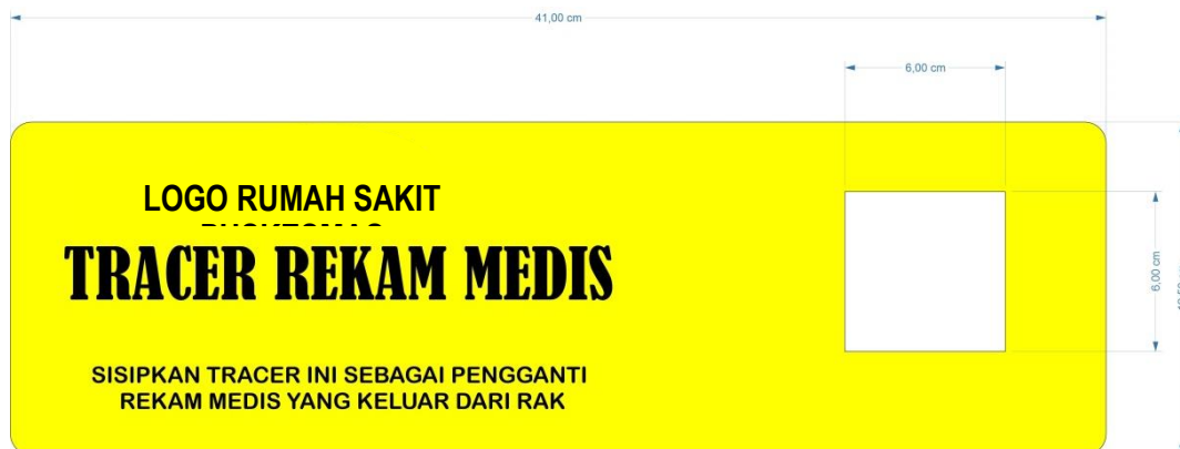
Gambar 1. Tracer Rekam Medis

Adapun bentuk dan ukuran tracer rekam medis disesuaikan dengan kebijakan rumah sakit, sedangkan warna tracer rekam medis harus kontras dengan warna map rekam medis.