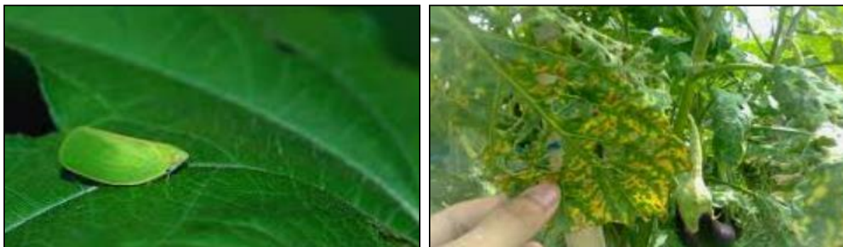
Gambar 2. Hama wereng pada tanaman terung

yang dapat dilakukan untuk mengurangi ledakan serangan hama pada tanaman yang dibudidayakan (Harahap, 2009). Pada umumnya untuk mengendalikan serangan hama pada tanaman yang dibudidayakan, para petani akan menggunakan pestisida anorganik. Hal tersebut dilakukan karena menurut petani penggunaan pestisida anorganik lebih efektif untuk pengendalian serangan OPT jika dibandingkan dengan penggunaan pestisida organik. Namun jika dibandingkan dengan pestisida organik, penggunaan pestisida anorganik cenderung akan menimbulkan dampak negatif bagi kesehatan dan lingkungan dalam jangka waktu Panjang. Penggunaan pestisida anorganik secara tidak langsung akan menimbulkan residu dan mengakibatkan terjadinya pencemaran pada tanah, air, dan udara (Rismunandar, 2009).